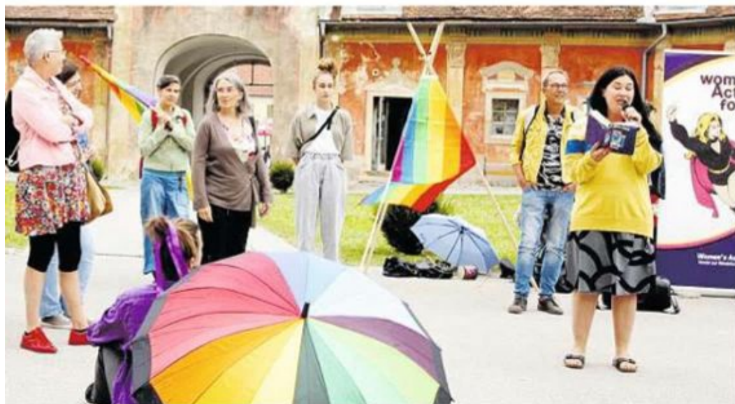
und Akzeptanz standen bei der Kundgebung im Kirchhof im Mittelpunkt