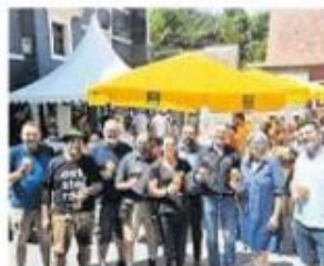
Bierliebhaber kamen bei dem Fest auf ihre Kosten

Vor Kurzem fand das erste Bierbrauerfest im Hof der Pfeilburg in Fürstenfeld statt. Organisiert wurde es von den drei Privatbrauereien Eders Biobier, Fürstenbräu und Nibelungengold. Verschiedene Biersorten konnten verkostet werden.