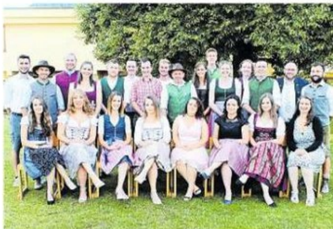
Das sind die Absolventen der Abendschule Landwirtschaft